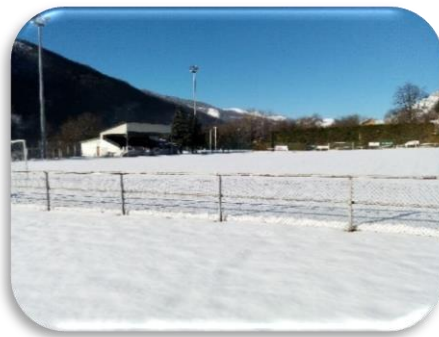
Janvier 2017 – Le stade Paul Fédou vêtu de son manteau blanc

Par chance l'entraînement délocalisé à Castelmaurou permet cette faculté à se remettre vite dans le bain. Même si la saison du blanc et le report des matchs coûtent toujours quelques points précieux, comptons sur notre équipe pour ne rien lâcher mentalement. L'emploi du temps est bien garni jusqu'à la fin mai! Jouer à Luzenac c'est aussi savoir s'adapter aux aléas climatiques pour pouvoir retrouver sereinement la marche en avant à Paul Fédou, après la fâcheuse coupure de 2 mois.