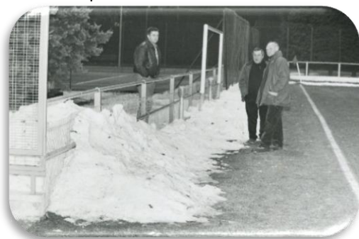
Janvier 1997 – Dirigeants perplexes sur l'état du terrain

Sur la question météo, nul n'est prophète en son pays, mais on peut néanmoins affirmer sans être expert qu'en hiver il neige... Même si l'hiver dernier n'a apporté que quelques petits centimètres de neige... à 600m d'altitude, cette année il en est tombé pas loin de 30, très précisément le 13 janvier dernier. Pluie et gel par la suite, cela a suffi pour croûter la couche en profondeur et contraindre le terrain à une fonte très lente. Certes l'or blanc est une précieuse ressource pour le territoire montagnard avec ses retombées économiques sur les vallées, sauf que pour les footballeurs la neige est plutôt synonyme d'engourdissement. Depuis le 17 décembre, jour du match contre Blagnac, la pelouse de Paul Fédou est restée en hibernation. L'expérience nous a enseigné qu'une longue coupure est ici toujours préjudiciable au rythme des joueurs, qu'il leur est plus difficile de retrouver les repères et à relancer les automatismes.