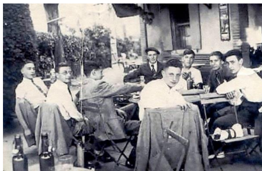
U.S.T.L. 1944 _ Verre de l'amitié au café Maffre

Fi de la diététique, c'était la meilleure thérapie de groupe, le bon défouloir de l'équipe. Tout le monde s'y sentait plus jeune, plus en forme, avec soif de revanche en cas de défaite. Ce sont ces moments-là qui font courir après un ballon, qui relancent des projets de jeu autour des beloteurs enfumés. Et puis des sorties au radar qui n'auguraient pas de lendemains chantants... C'était antan, mais cette tradition du club familial, convivial et festif est restée scellée à ces moments privilégiés. Savourer des joies simples qui valaient mieux que tout l'or du football, et sans modération, c'était aussi ça l'esprit Luzenac.