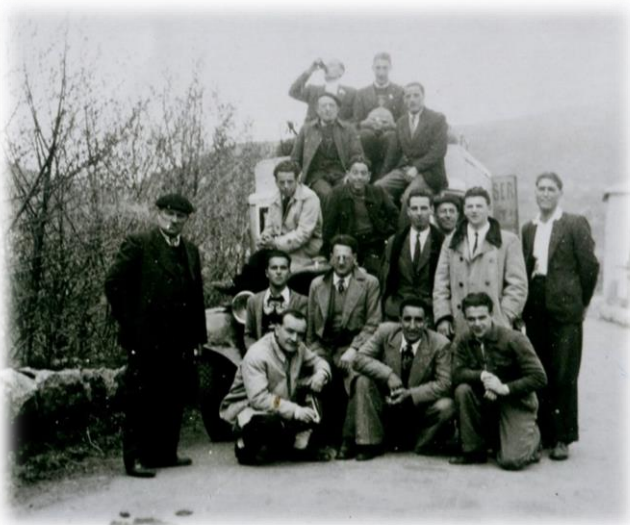
L'USTL en Cerdagne avec le camion (1949)