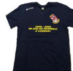
Tee shirt 80 ans : 15,00€