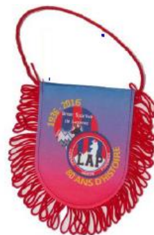
Fanion : 5,00€