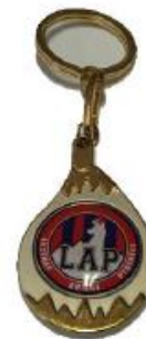
Porte – clés : 5,00€