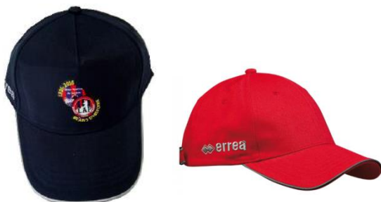
Casquette 80 ans – Casquette Club: 12,00€ (Bleu ou Rouge) (Rouge ou Bleu avec logo du Club)