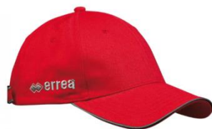
Casquette 80 ans – Casquette Club: 12,00€ (Bleu ou Rouge) (Rouge ou Bleu avec logo du Club)