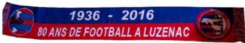
Echarpe tissée 80 ans : 10,00€